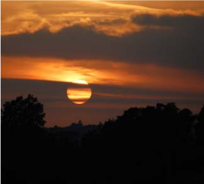
Imatge d'una posta de sol darrera una muntanya.