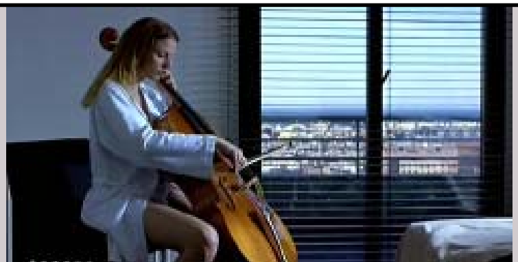
'El silenci abans de Bach', del director barceloní Pere Portabella, estrenada recentment.

"El cinèfil és, per definició, una persona pacient, que sap que l'espera val la pena"