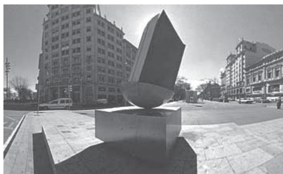
Escultura de Joan Brossa ubicada entre Gran Via i el Paseig de Gràcia.

L'interès per honrar el llibre com una escultura reapareix a la dècada dels noranta.